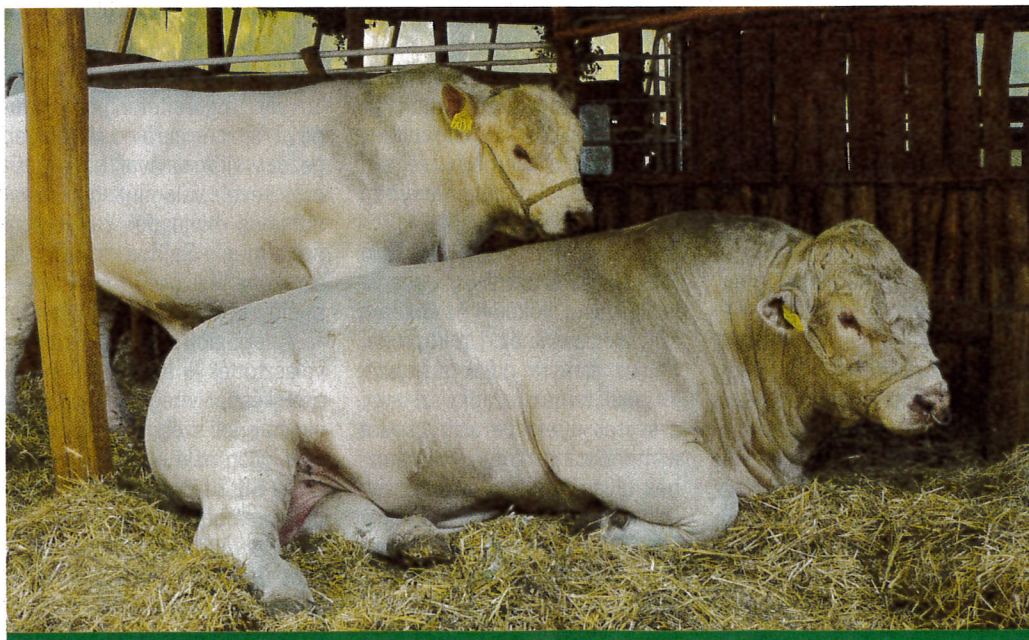
Eladásra váró bikák a pihenőboksokban

– Lassan az is megszokottá válik, hogy a bikák fő tulajdonságai között a spermavizsgálati eredményeik is szerepelnek. A saját tenyészetemben öt éve kezdtem el ellenőriztetni a bikákat, 2017 elején pedig az egyesületünk úgy döntött, hogy az összes tagnak azt javasolja, végeztessék el ezt a vizsgálatot a tenyészeteikben. A tagoknak csak a vizsgálat költségeinek egyharmadát kellett kifizetnie, a többit az egyesület állta. Nagyon sokan éltek a lehetőséggel: 230 bika spermáját ellenőrizték a szakemberek. Beigazolódott ennek haszna: több tenyésztőnél akadtak kisebb-nagyobb problémák, amelyek többségére a vizsgálatok nélkül nem derült volna fény, vagy talán csak akkor, amikor már nagyobb a baj: üresen maradnak a tehének. Tapasztal-